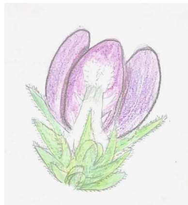
9月教室の？あそびより A.H.

★実りの秋になり、たくさんの生き物が冬の備えを始めています。みなさんも、季節に合わせた服装を考えよう。