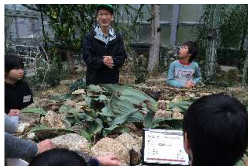
植物園観覧温室（昨年の活動より）

○日程 7：45 宮脇バス停 出発（美山の人） 7：55 下佐々江トンネルを抜けた南側 出発（園部・八木・日吉の人） 8：20 ウッディー京北前 出発（京北の人） 9：20 植物園着・開講式 9：40 活動（？遊びなど） 12：00 昼食 13：00 活動（作品発表・整理ノートなど） 15：00 閉講式 15：15 植物園出発 16：15 ウッディー京北前 到着 解散 16：40 下佐々江 到着 解散 16：50 宮脇バス停 到着 解散